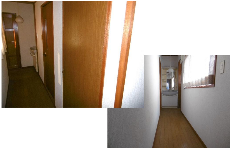
2階 廊下・洗面台・収納