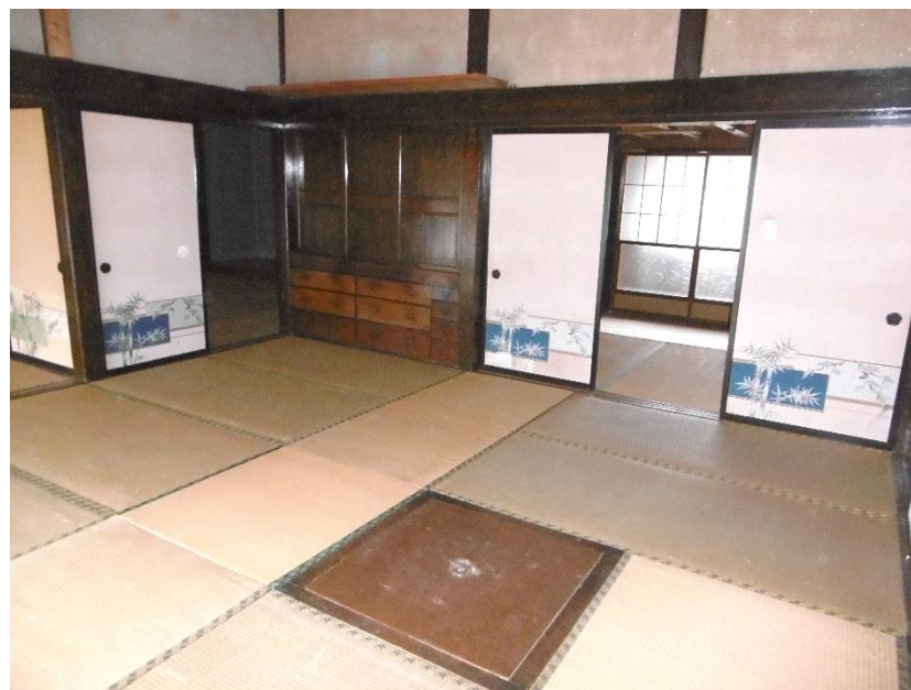
1階 和室 6 畳③