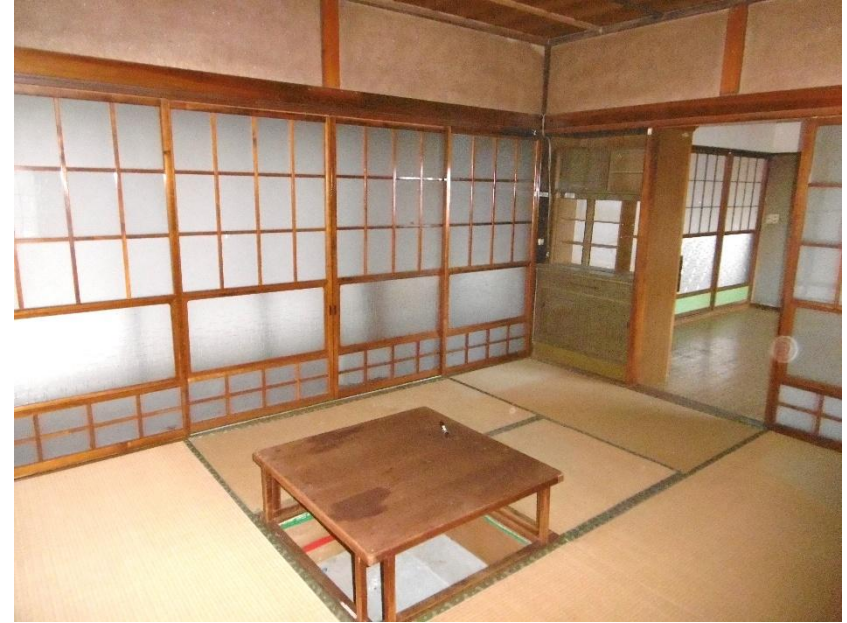
納戸・ボイラー室