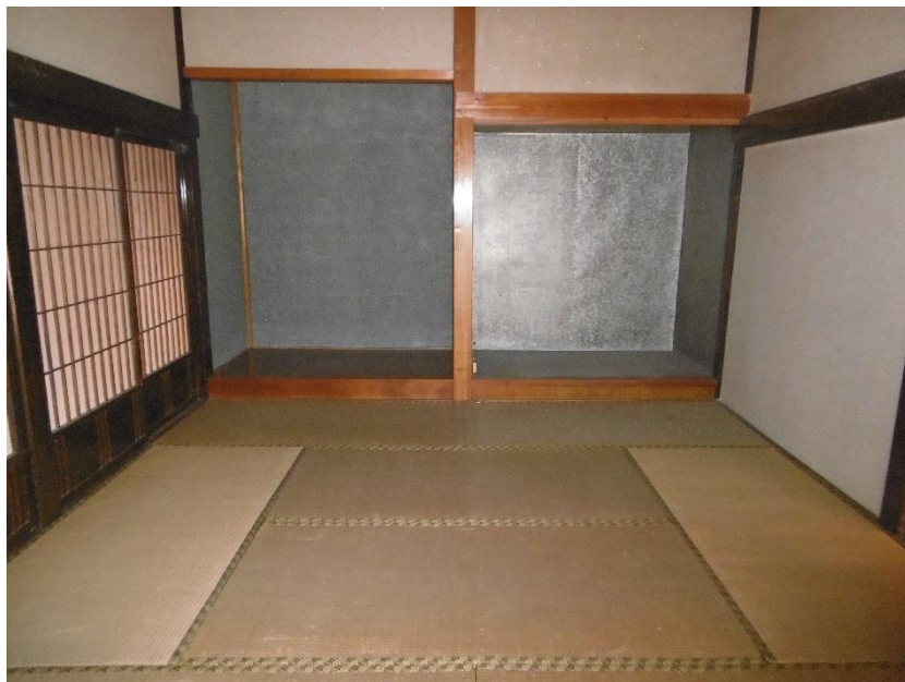
1階 和室 8畳