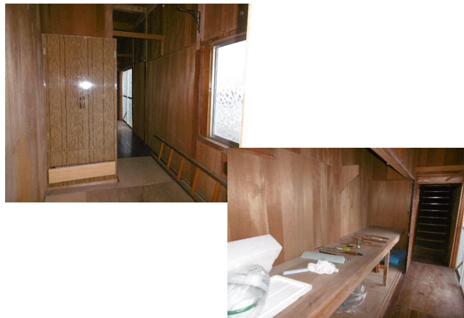
1 階 階段・廊下③・収納