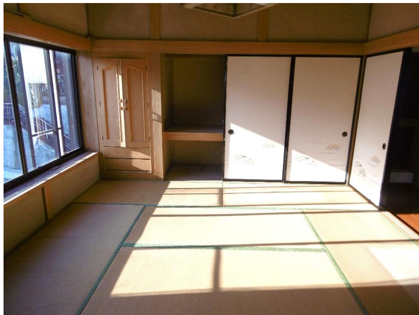
2階 和室 8畳