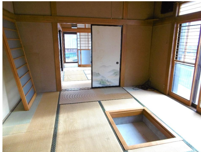
1階 和室 8畳①