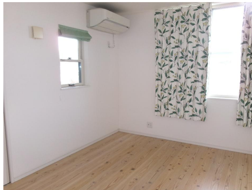
2階 洋室 6 畳①