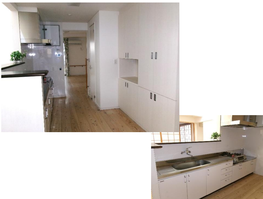
1 階 台所 5.9 畳・食器棚