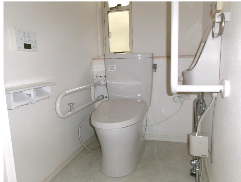
1 階 トイレ①