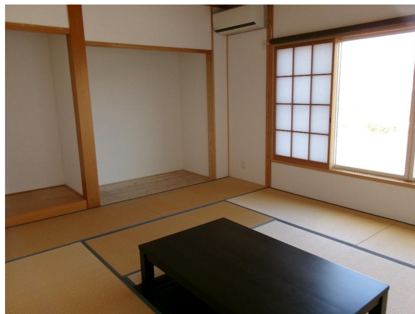
1階 和室 10畳