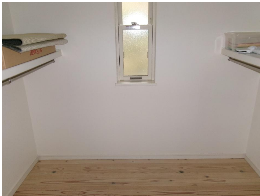
1 階 ウォークインクローゼット