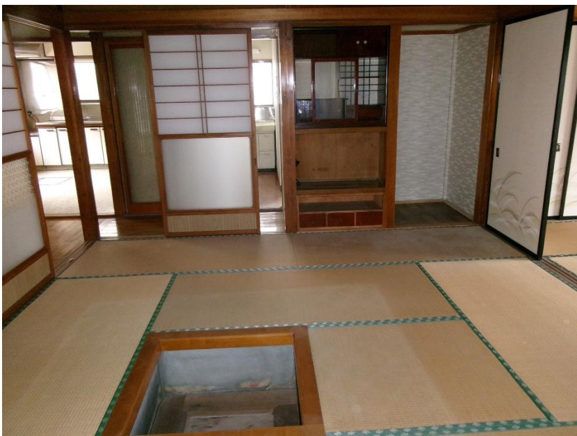
1階 和室 8畳①