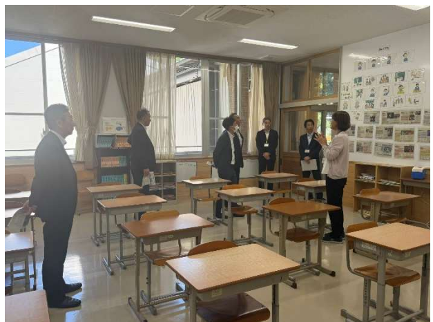
美咲町立旭学園：小中学校を統合した岡山県初の施設一体型義務教育学校 見学