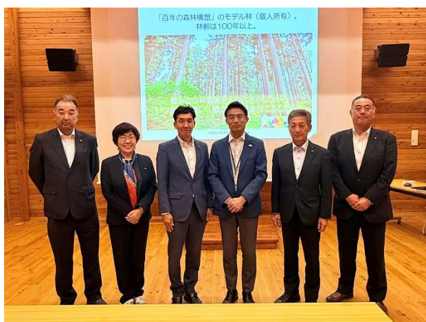
上山副村長を囲んでの記念撮影