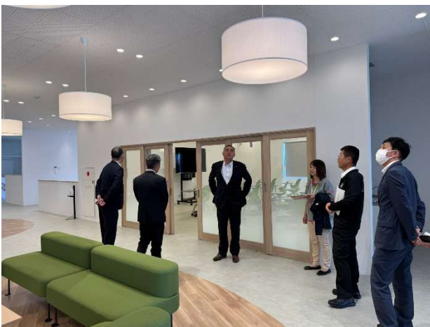
複合施設「みさキラリ」見学