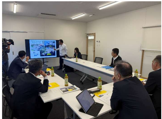
青野町長にご説明をいただく