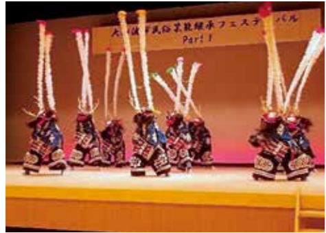
赤澤こども鑑剣舞(大船渡町)