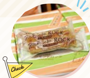
おおうらやのアーモンドロックは、返礼品として大人気★

昨年9月に返礼事業者に登録しましたが、予想外の多くのご注文をいただき驚いています。商品の撮影やポータルサイトへの掲載などは、すべて市が委託している事業者がやってくれるので、難しいこともなく始められました。また、今までとは違う商売の仕方を学ぶことができました。何より、大船渡の活性化に少しでも貢献できてとても嬉しいです。