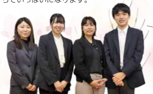
事業者の皆さん返礼品募集中です+

A 震災から10年以上がたち、さらに全国各地で災害が起きていながらも、まだ東日本大震災からの復興を応援してくださっている方々がいることです。ずっと忘れずにいてくださる方々に感謝の気持ちでいっぱいになります。