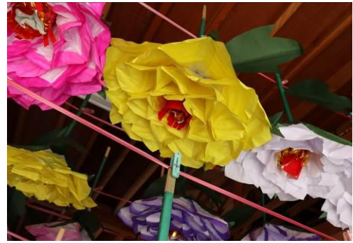
山車装飾牡丹花準備作業（吉野町）