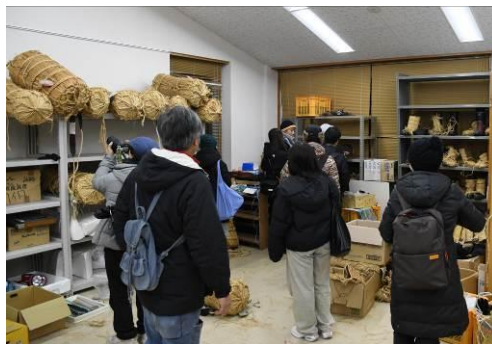
装束・道具類の解説

〔アンケート結果〕回答者10名中10名（100%）が「とてもよかった」「よかった」と回答。