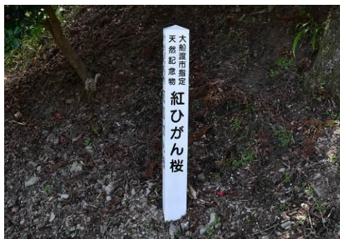
紅ひがん桜（盛町）標柱設置状況