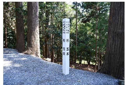
杉（末崎町）標柱設置状況