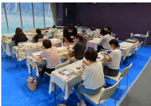
釣針づくりの様子

釣り体験：回答者12名中11名（91.7%）が「とてもよかった」「よかった」と回答