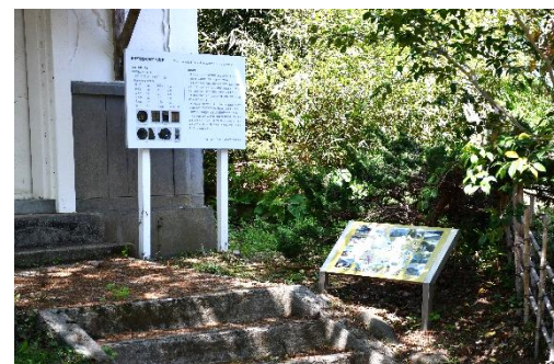
解説板・案内板設置状況