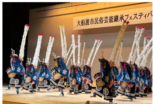
前田子ども鹿踊り