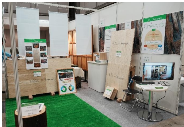
「モクコレ 2026」での展示の様子