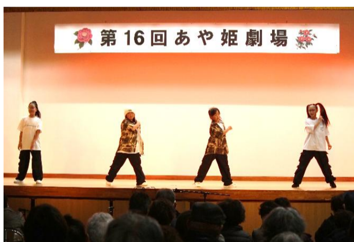
小学生によるダンス