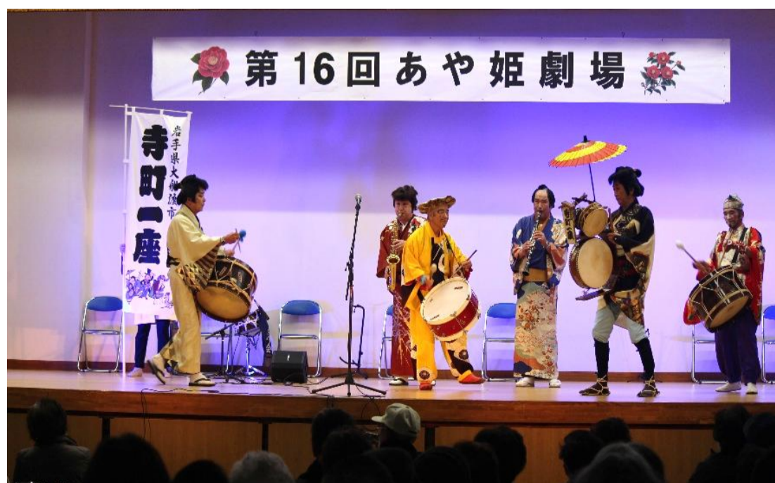
チンドン寺町一座