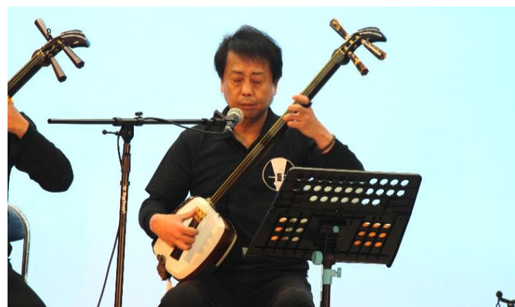
民謡・津軽三味線黒澤会 会主他