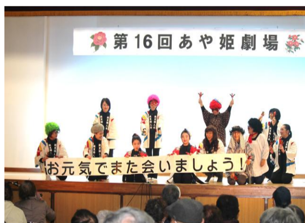
スタッフ・ボランティアによる会場の皆様へのお礼