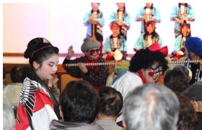
小・中学生による大漁唄い込みと餅まき