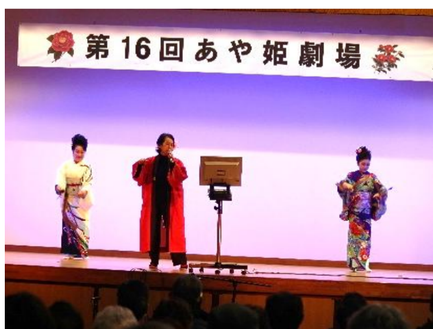
カラオケを楽しむ参加者たち