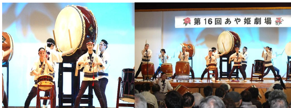
岩手県立大船渡東高校太鼓部の演奏