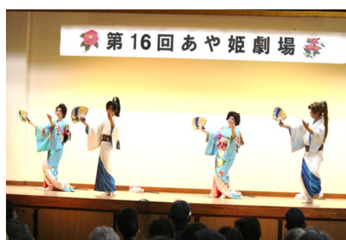
幸崎流さすけ会 会主他