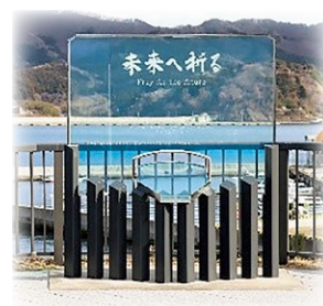
祈りのモニュメント

時 3月11日(水) ●代表献花など…午後2時46分～3時 ●一般献花…午後3時～5時 場 みなと公園展望広場 他 ●犠牲者氏名を掲示した芳名板は、3月5日(木)～24日(火)の期間、設置します。 ●午後2時46分のサイレンに合わせて黙祷します。 ●一般献花はどなたでも参加可能です。献花用の花は持参してください。 問 防災管理室(☎内線251)