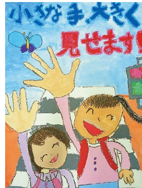
令和7年度 岩手県交通安全ポスターコンクール

市内小中学生を対象に実施した「交通安全ポスターコンクール」の応募作品104点を展示します。ぜひ会場でご覧ください。 時 1月20日(火)午後3時～25日(日)午後7時 場 サン・リア北側階段 問 市民環境課生活安全係(☎内線127)