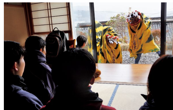
目の前で迫力ある舞を披露する虎舞