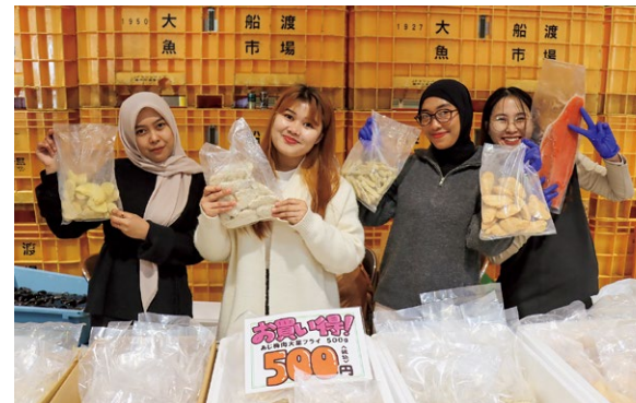
インドネシア出身の特定技能生も笑顔で販売