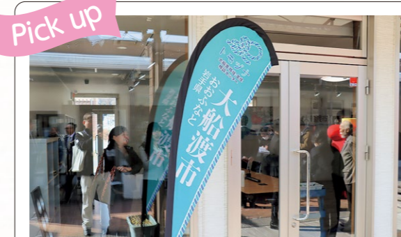
2月24日開設の大船渡移住・定住相談センター「トモヅナ」を拠点に移住希望者などに寄り添う取り組みを継続