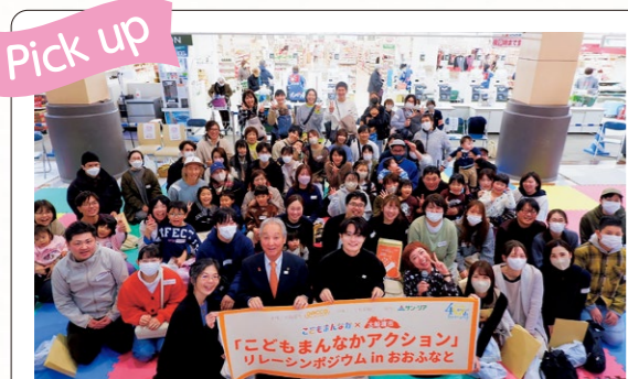
子育てを社会全体で支える環境づくりを強化するため、子育て支援の約60の取り組みを継続