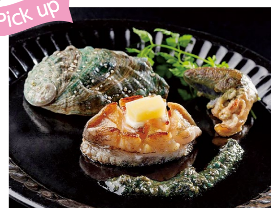
魅力あるお礼品の開発やプロモーション活動でふるさと納税の寄附額を増やし、関係人口も拡大