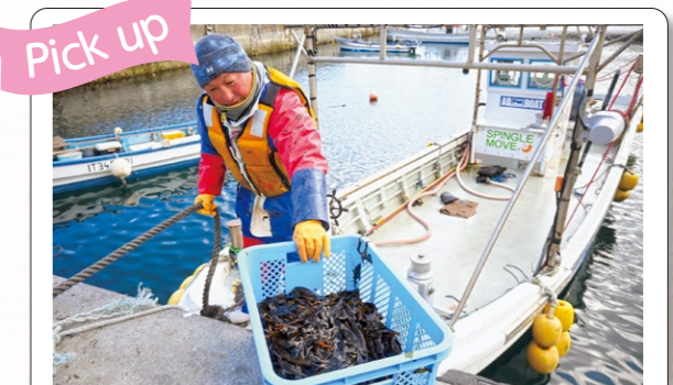
地域資源を生かしてにぎわいや雇用を創出する「海業」の綾里漁港での取り組みなどを支援