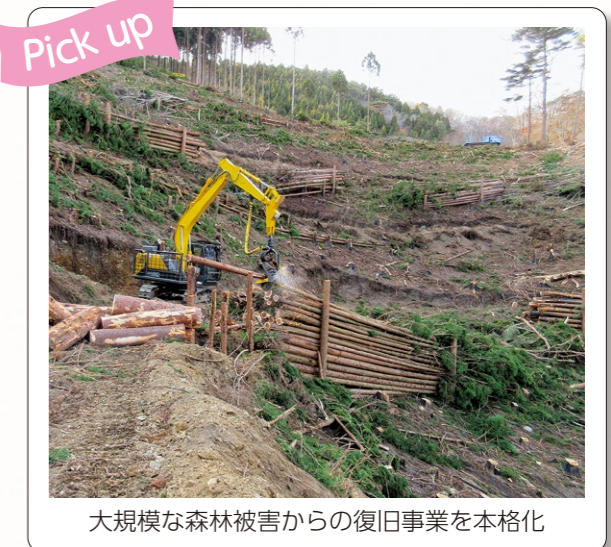
大規模な森林被害からの復旧事業を本格化