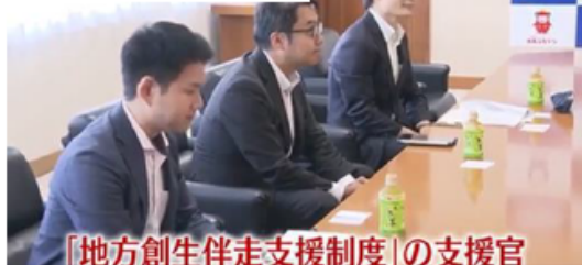
「地方創生伴走支援制度」の支援官