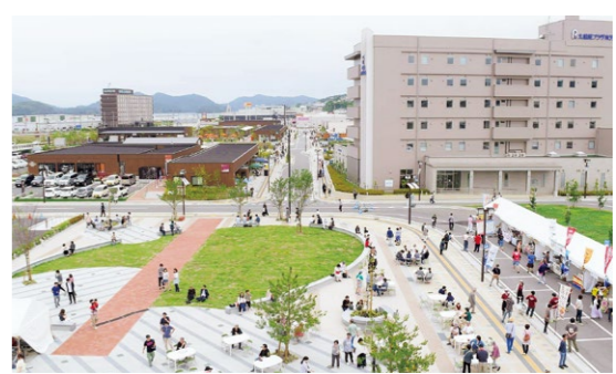
人々が集う、活気あふれるまちを目指して

令和2年度の「大船渡市総合計画2021基本構想」と「前期基本計画」の策定後、人口減少の進行やデジタル化の急速な進展などにより、社会環境は大きく変化しています。併せて、市民ニーズも多様化し、安全・安心への関心が高まっています。