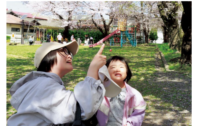
満開の桜を見上げる親子