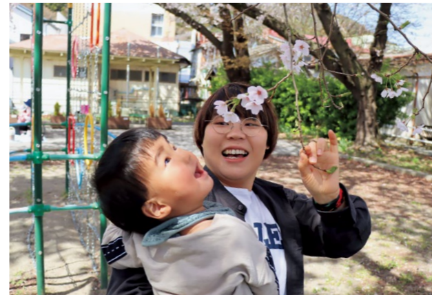
桜を手に親子で楽しいお花見

また、子どもたちは元気いっぱい公園を駆け回り、思い思いに春の公園を楽しんでいる様子が印象的でした。満開の桜に笑顔を見せて、頭上を見上げる子どもたちの姿もとてもかわいらしく、きれいに咲き誇る桜と子どもたちの笑顔に包まれた、心温まる春の一日となりました。