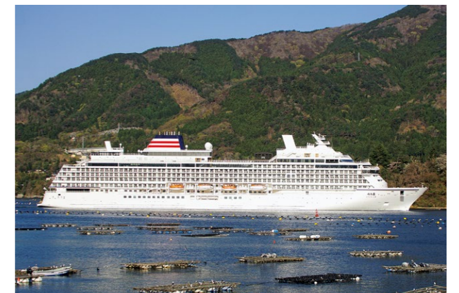
養殖棚と珊瑚島の間を航行する飛鳥Ⅲの入港