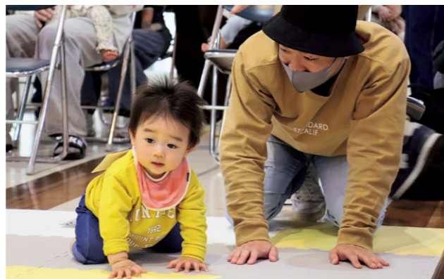
かわいらしい姿で3メートル先のゴールを目指す赤ちゃんたち