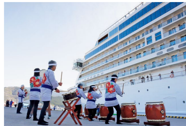
迫力ある演奏で飛鳥Ⅲをお出迎え

次回の寄港は9月29日の予定です。ぜひ皆さんも一緒にお出迎えをして、港を盛り上げましょう！