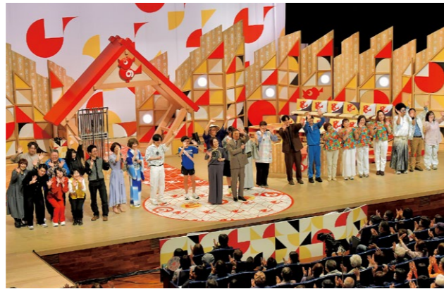
会場が一つになったエンディングの様子

出場者の皆さんが心を込めて歌う姿に、客席からは大きな拍手や温かい声援が送られ、会場が一つになって盛り上がりしました。