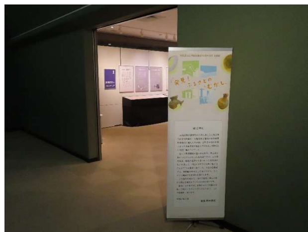
(1) 企画展「発見！ふるさとの“むかし”」