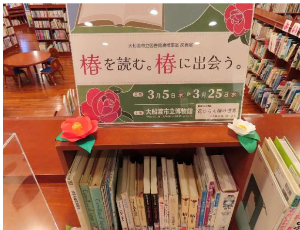
(2) 図書展「椿を読む。椿に会う。」 (3/5~3/25)