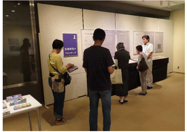
(2) 企画展「花ひらく椿の世界」