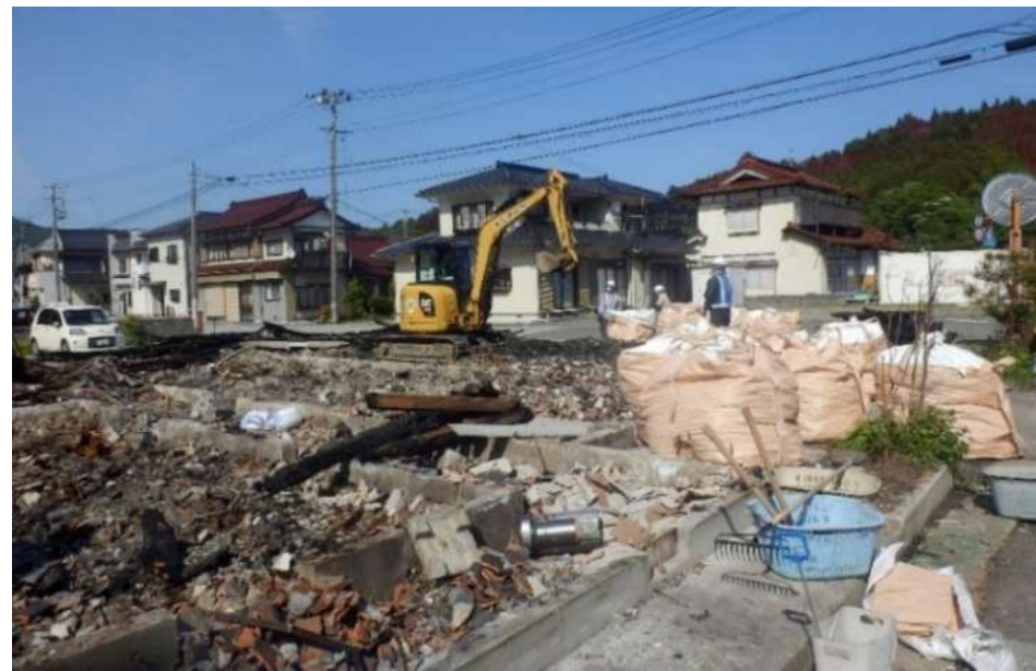
被災家屋等の公費解体