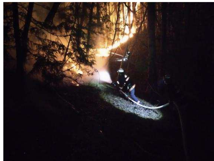
消防隊員による懸命な消火活動