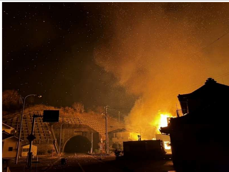
三陸町綾里字港地内 火の手が住宅にまで及ぶ