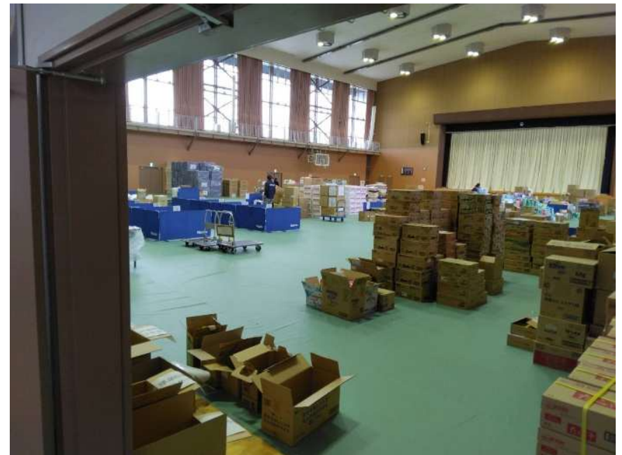
各所から寄せられた支援物資