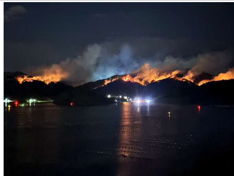
大船渡町から赤崎町方面を望む