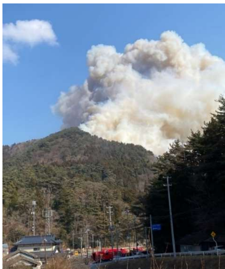
火災発生直後の赤崎町字合足地内