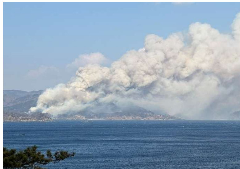
火災発生直後の濃煙(赤崎町、三陸町綾里)