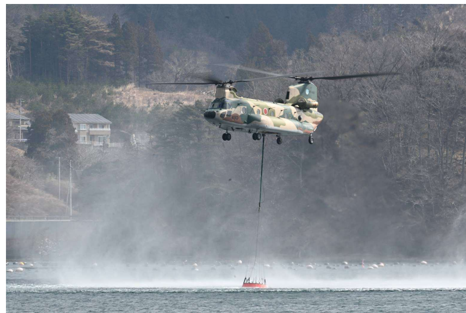
自衛隊大型ヘリによる海水取水