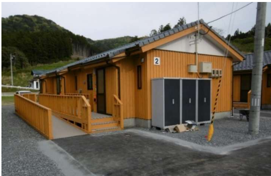
建設型応急仮設住宅(蛸ノ浦地区)