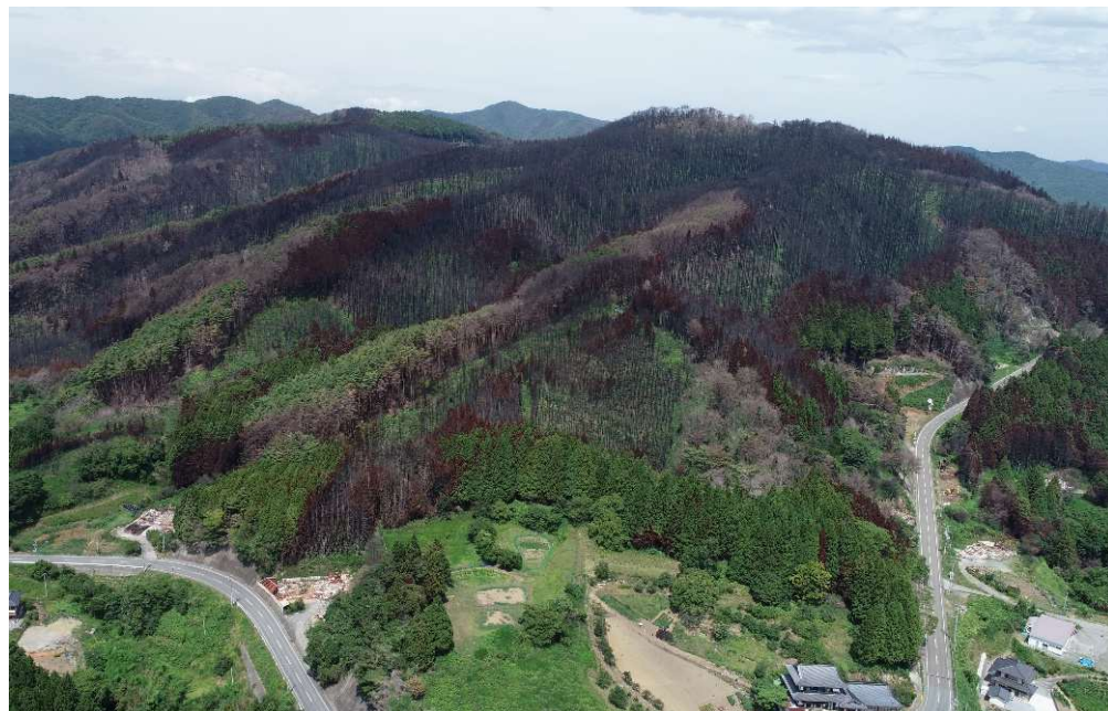
森林の被害状況（三陸町綾里小路地域）

※火災等で樹木が大きく損傷し、森林としての役割が果たせず、雨で土砂が流れやすくなるなど土地の安全性が低くなったため、県が災害関連緊急治山事業等を実施する箇所の事業費。