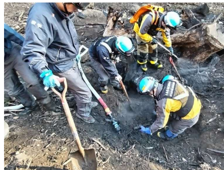
大船渡地区消防組合、市消防団、県内相互応援隊による現地の総合的調査