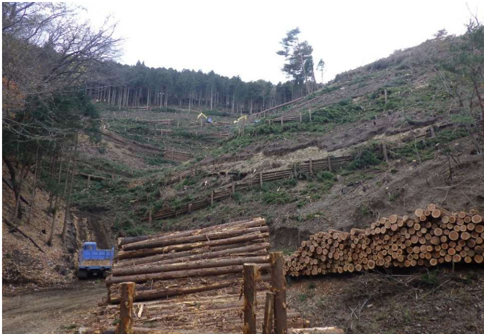
森林災害復旧事業（被害木の整理）