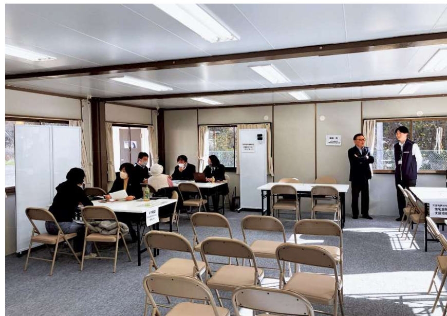
住宅再建支援個別相談会