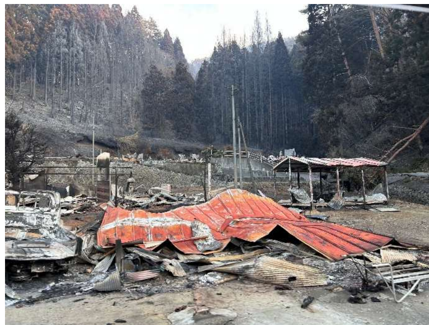
火災の被害を受けた家屋