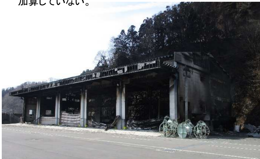
作業保管施設(定置漁業用倉庫)

※()内の金額は、商工・観光業関係に係る「事業用設備(給水管、冷凍庫、給湯器等)」の額に含まれるため、被害額合計には加算していない。